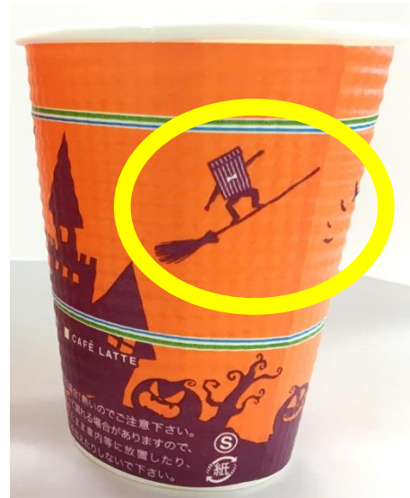
ハロウィンデザインカップ レアバージョン

ファミリーマートは、「あなたと、コンビニに、ファミリーマート」のもと、「Fun&Fresh」をテーマに、小商圈における生活インフラとして、来るたびに楽しい発見があり、新鮮さにあふれた、お客さまの気持ちにいちばん近いコンビニエンストアを目指してまいります。