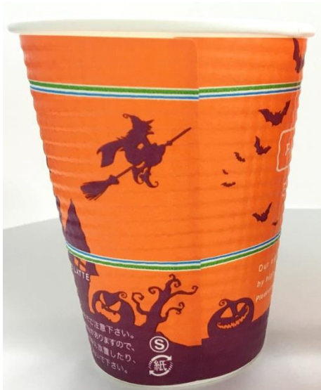
ハロウィンデザインカップ 通常版