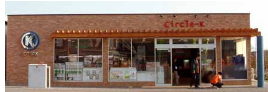
長久手会場内北ゲート サークルK「愛・地球博」店