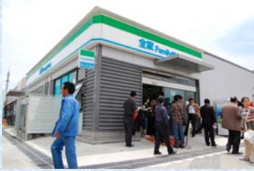
〈中国：上海万博への出店〉