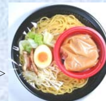
<左:冷し大盛つけめん>