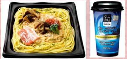
<左:パンチェッタと5種のきのこのクリームソース> <右:あじわい Famima Café ブルーマウンテンブレンドコーヒー>