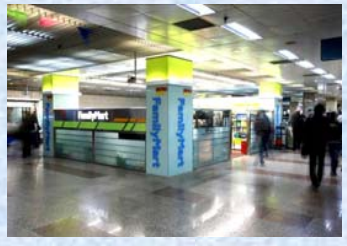
〈中国：上海地下鉄構内店舗〉