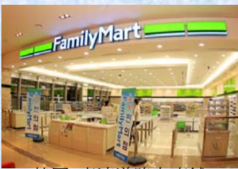
〈韓国：高速道路内店舗〉