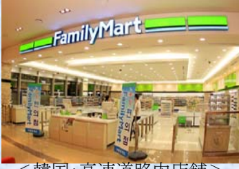
〈韓国：高速道路内店舗〉