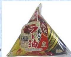
<具入りラー油おむすび>

既存店日商伸び率 :97.7% / 客数 :960人(前年同期差+14人) 差益率 :28.45%(前年同期差 :+0.35%)