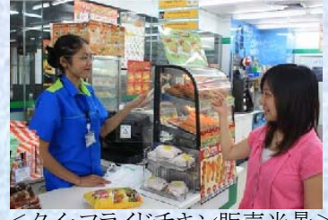
〈タイ：フライドチキン販売光景〉