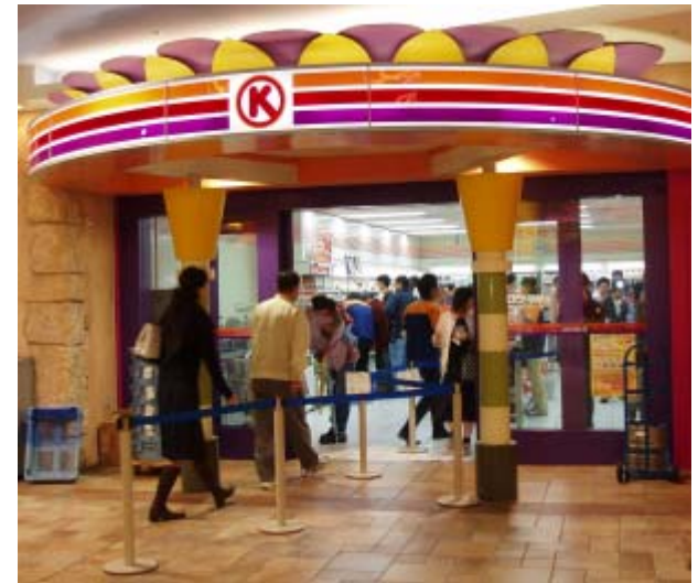
2005年10月開店 サークルK「東京競馬場」店